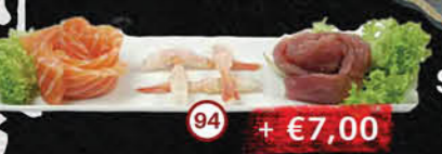
94 Sashimi Moriawase Zalm, Tonijn & Garnaal Salmon, Tuna & Shrimp