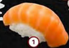
Sake Zalm Salmon