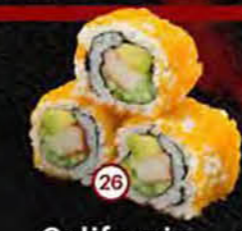
California Krab, Avocado & Komkommer Crab, Avocado & Cucumber