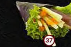
Maguro Komkommer, Tonijn & Sla Cucumber, Tuna & Lettuce