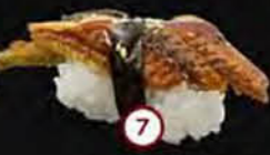
Unagi Paling Eel