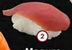
Maguro Tonijn Tuna