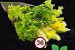
Yasai Komkommer, Zeewier & Radijs Cucumber, Kelp & Radish