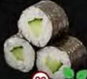
Kappa Komkommer Cucumber