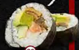
Futomaki (2 stuks/pieces) Komkommer, Krab, Zalm, Tonijn, Avocado & Radijs Cucumber, Crab, Salmon, Tuna, Avocado & Radish