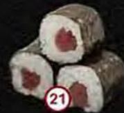
Tekka Tonijn Tuna