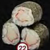
Kani Krab Crab