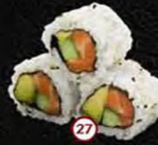
Sake Zalm, Avocado & Komkommer Salmon, Avocado & Cucumber