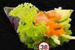
Sake Komkommer, Zalm & Sla Cucumber, Salmon & Lettuce