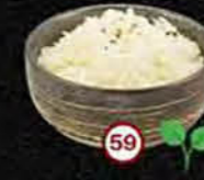
Hakuhan Witte Rijst Plain Rice

Vegetarische gerechten Vegetarian dishes