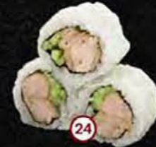
Crispy Chicken Komkommer & Kip Cucumber & Chicken