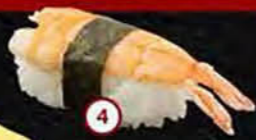
Ebi Garnaal Shrimp