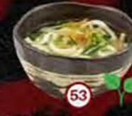
Udon Yasai Soup Groenten & Udon Vegetables & Udon