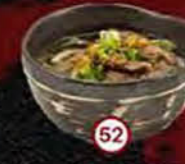
Udon Gyu Soup Rib Eye & Udon