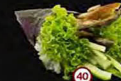
Unagi Komkommer, Paling & Sla Cucumber, Eel & Lettuce