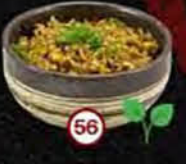
Yaki Meshi Gebakken Rijst Stir Fry Rice