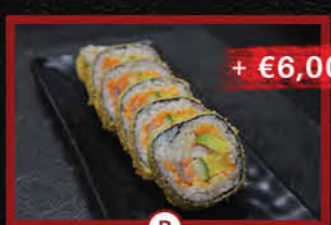
B Fried Futomaki (6 stuks/pieces) Gefrituurde Futomaki