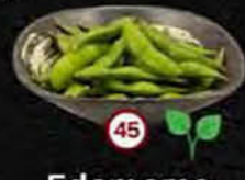
Edamame Sojabonen Soybeans