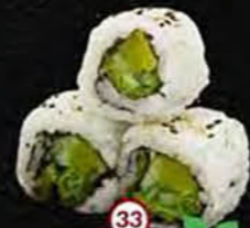
Yasai Radijs, Sla & Komkommer Radish, Lettuce & Cucumber