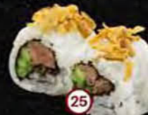
Beef Beef, Komkommer & Gebakken Ui Beef, Cucumber & Fried Onion