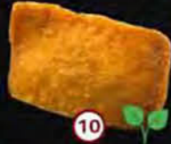
Sake Cheese Zalm Kaas Salmon Cheese