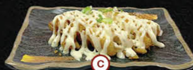
C Torikatsu Van Het Huis Gepaneerde Kip Met Kaasvulling Chicken Cutlet With Cheese Filling