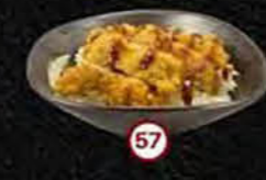
Torikatsu Donburi Gefrituurde Kip & Rijst Fried Chicken & Rice