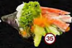
California Komkommer, Avocado & Krab Cucumber, Avocado & Crab