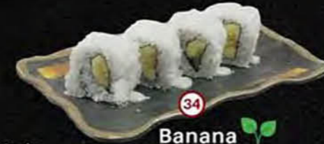
Banana Kokos, Banaan, Avocado Coconut, Banana, Avocado