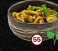
Yaki Udon Gebakken Udon Stir Fry Udon