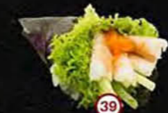
Ebi Komkommer, Garnaal & Sla Cucumber, Shrimp & Lettuce