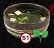
Miso Soup Tofu, Zeewier Tofu, Kelp