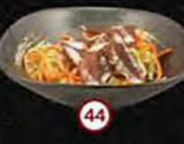
Maguro Tonijnsalade Tuna Salad