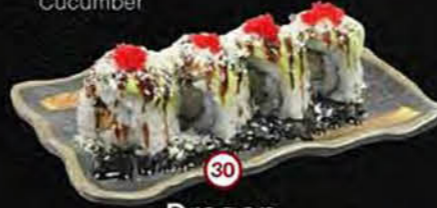
Dragon Gefrituurde Garnaal & Avocado Fried shrimp & Avocado