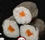
Sake Zalm Salmon