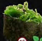
Wakame Zeewier Kelp