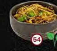
Yaki Ramen Gebakken Noodles Stir Fry Noodles