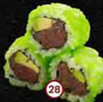
Spicy Salad Tonijn, Chili & Komkommer Tuna, Chili & Cucumber