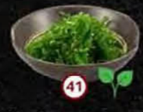
Chuka Wakame Zeewier Kelp