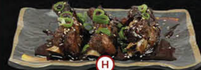
H Spareribs Van De Chef Spareribs