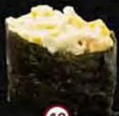
Corn Mais & Krab Corn & Crab