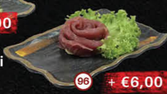
96 Maguro Sashimi Tonijn Tuna