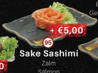
95 Sake Sashimi Zalm Salmon