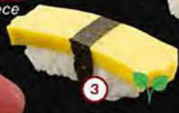
Tamago Ei Egg