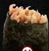
Tabi Grijze Garnaal Bay Shrimp